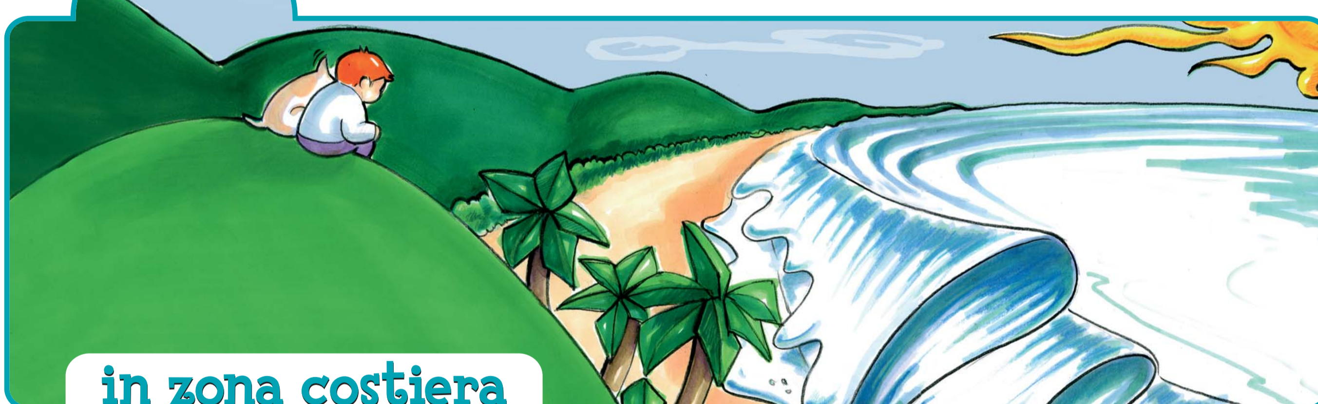
in zona costiera

Cerca di raggiungere un luogo sopraelevato, lontano dal mare, perché potrebbe arrivare un'onda di maremoto.