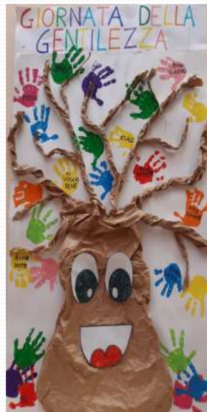
Giornata della gentilezza