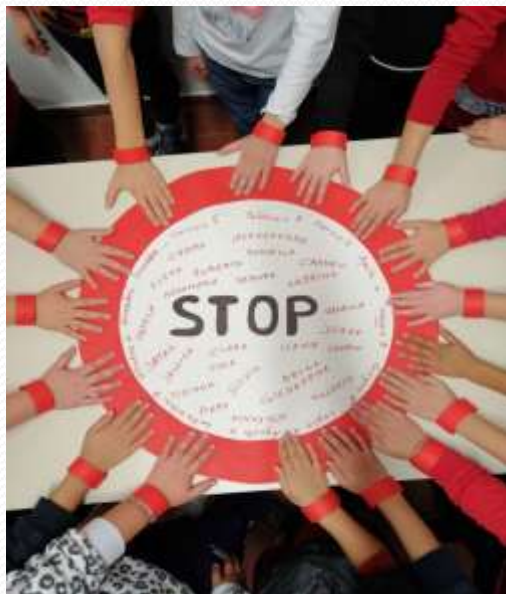
Giornata Stop alla violenza sulle donne